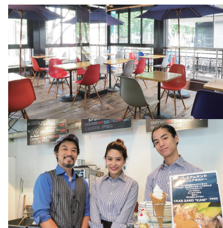
『ベーカリーカフェ426 表参道』(1F)